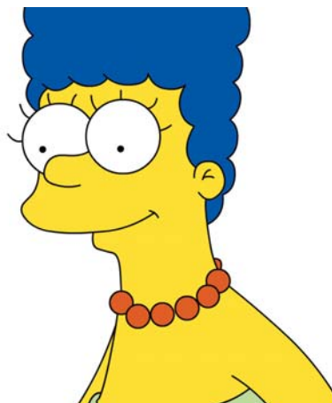
■ Marge Simpsons