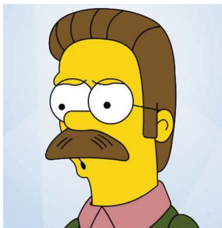
■ Ned Flanders

Por ejemplo, es posible observar que «Los Simpsons» abundan en situaciones donde entran en juego principios y valores a la hora de actuar o decidir y donde la tendencia de sus personajes es a obrar según las circunstancias del momento o según su propia conveniencia más que responder a una línea fija de conducta. Es el caso de Homero, el padre, que no trepida en hacer promesas a su familia, que por supuesto incumple o justificar actitudes inmaduras de las maneras más absurdas y ridículas. En ningún caso podría este progenitor obrar como modelo de conducta para sus hijos en la vida real o aportarles estabilidad emocional. Pues bien, en el caso de esta familia animada las situaciones logran ser corregidas al finalizar cada capítulo y nos dejan la sensación de un fi-