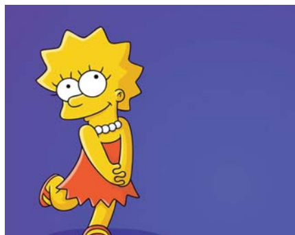
■ Lisa Simpsons