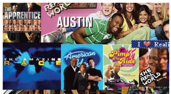
■ Reality Show