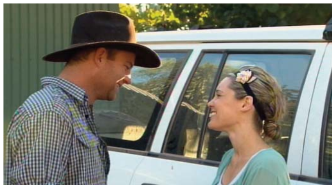
Farmer Wants a Wife