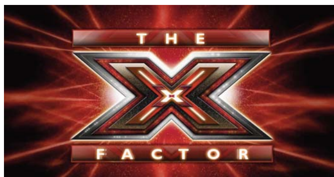
■ Facxtor X

Se ofrece una representación de unas relaciones afectivas y una sexualidad espectacularizadas y totalmente distorsionadas