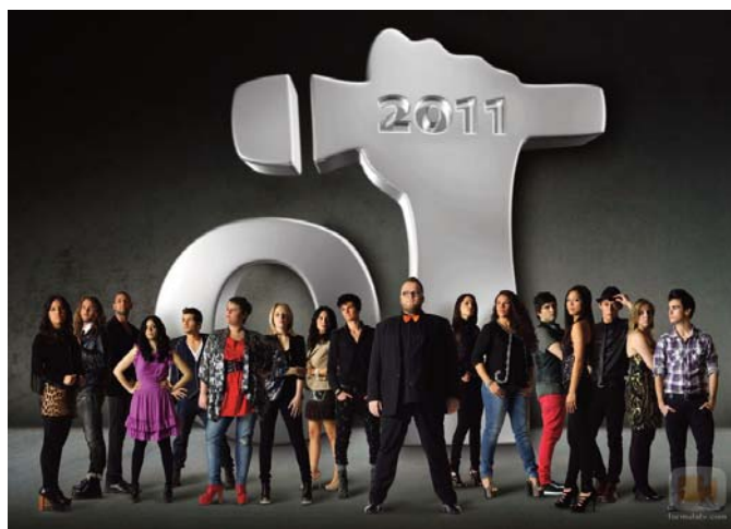
■ Operación Triunfo 2011 Protagonistas