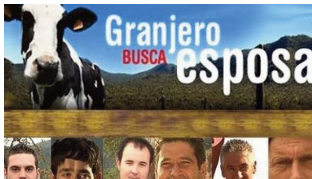
Granjero busca esposa