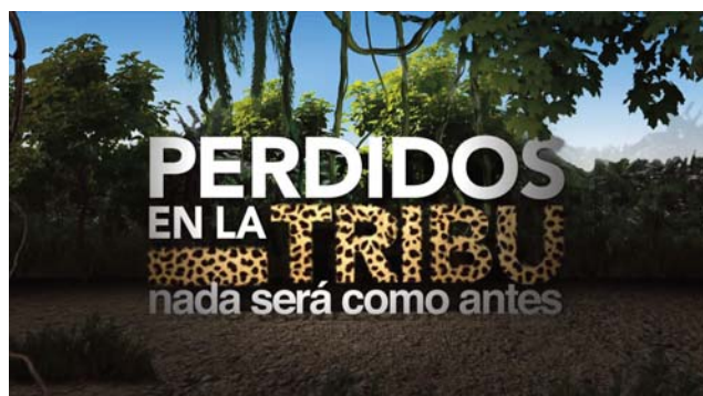
■ Perdidos en la tribu