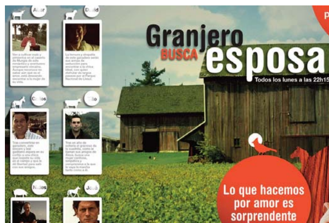
■ Granjero busca esposa