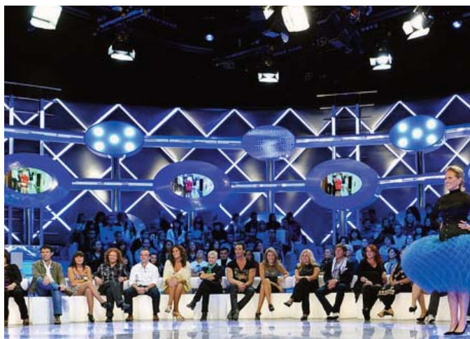
■ Gran Hermano. Plató

Dentro de esta segunda oleada de espacios de telerrealidad dedicados a alguna finalidad específica – por supuesto, aparte de la de la de obtener el premio económico- se encuentran los destinados a encontrar pareja. El grupo Mediaset lleva años ofreciendo varios formatos de este género en sus dos cadenas, Cuatro y Telecinco , con un éxito continuado de audiencia. Se trata de una competencia televisada y orquestada para conseguir fidelizar al espectador. Desde hace décadas se han emitido programas dedicados a encontrar pareja pero la novedad reside en hacer