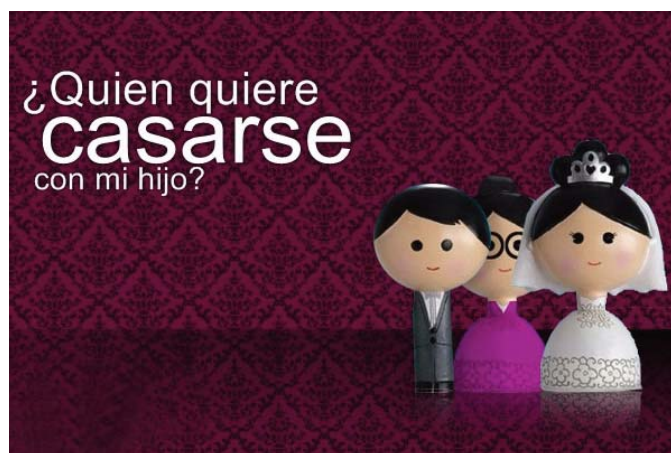
■ ¿Quién quiere casarse con mi hijo?