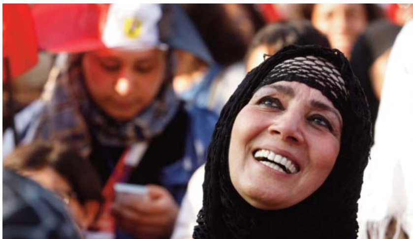
Primavera árabe Mujeres en la calle