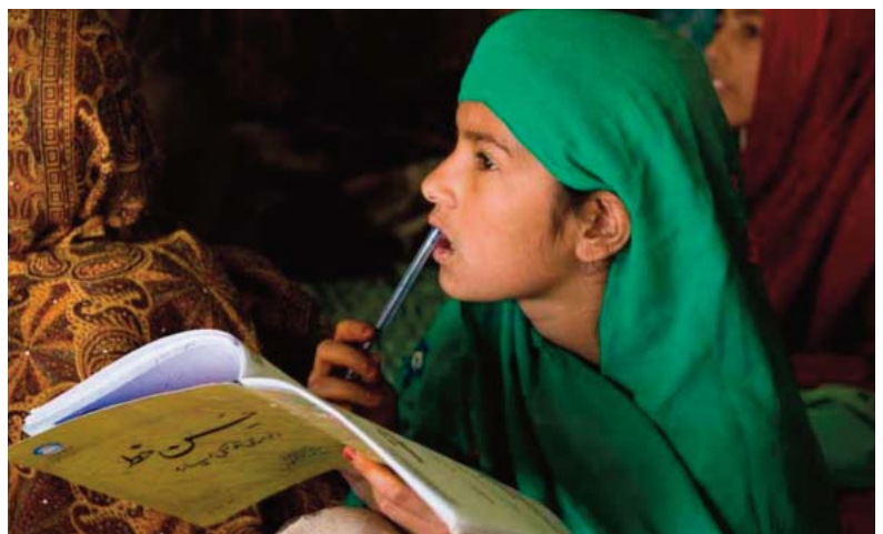
■ Niña paquistaní Escuela para las niñas