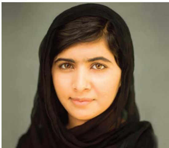
■ Malala Yousafzai Derecho a la educación

El miedo fue inmenso en la población. No era un miedo irracional. Un informe publicado por el Ejér-