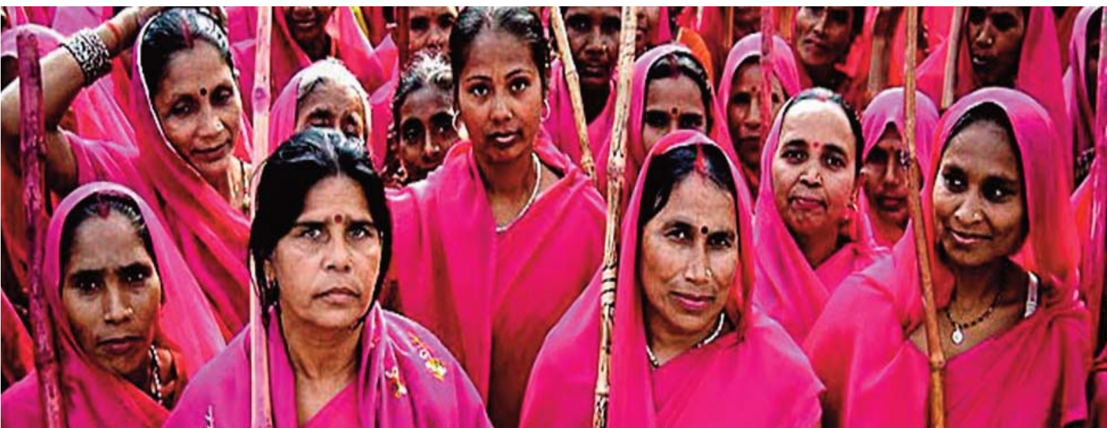
■ Gulabi Gang Las mujeres del sari rosa

https://dl.dropboxusercontent.com/u/2117114/priyashakti_portuguese.pdf