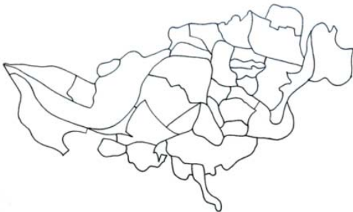
Figura 3. Imagen plano