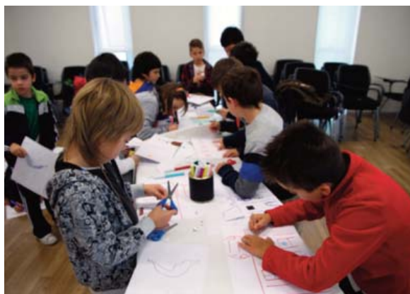
Figura 5. Alumnado trabajando

Una vez que construida esta ciudad conjunta se invitó al alumnado a realizar su ciudad de bolsillo, creada a través de la técnica pop up, reforzando de nuevo el paso de la segunda a la tercera dimensión