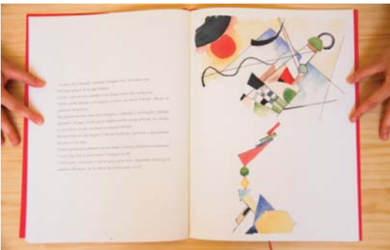
Figura 2. Álbum ilustrado: La rebelión de las formas. Fuente: Navarro, T. 2010, p. 26-27.