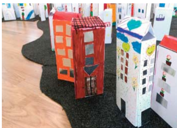
Figura 6. Ubicación de edificios