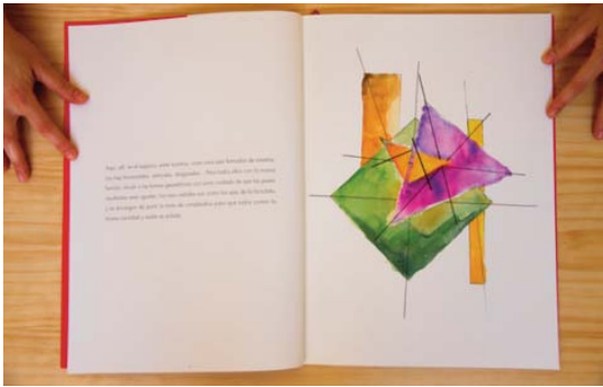
Figura 1. Álbum ilustrado: La rebelión de las formas. Fuente: Navarro, T. 2010, p. 4-5.