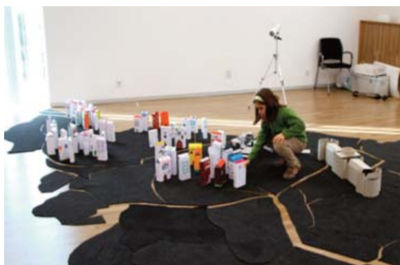
Figura 7. Ubicación de edificios