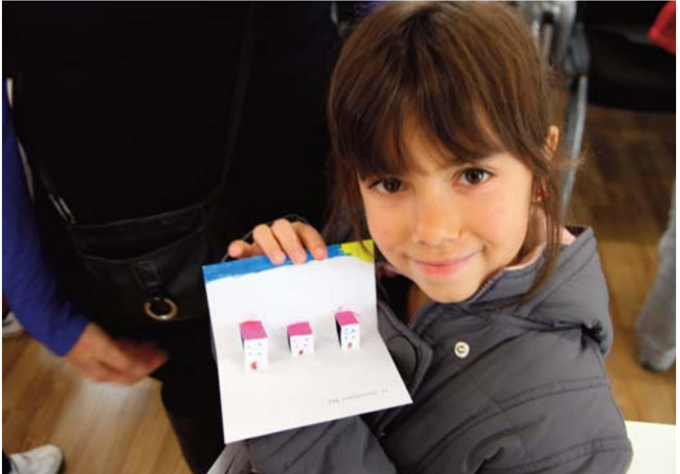
■ Figura 9. Ejemplo de ciudad pop-up

a partir de un plano. Se trata de un trabajo individual y mucho más libre que le permite no sólo crear, sino adquirir mayor autonomía en el diseño y ejecución de sus trabajos. Esta obra, ya que pueden llevársela a casa, también tiene como fin trascender al ámbito familiar permitiendo así crear vínculos afectivos con la familia. (Figura 9)