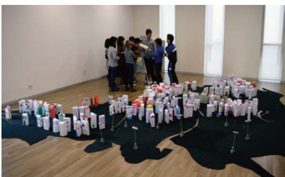
Figura 8. Ciudad sobre plano