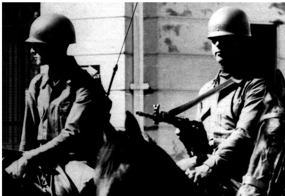
■ 1973, 11 de septiembre, Concepción, Chile. El ejército da un Golpe de Estado y ocupa las calles y el país © Foto de Enrique Martínez-Salanova.