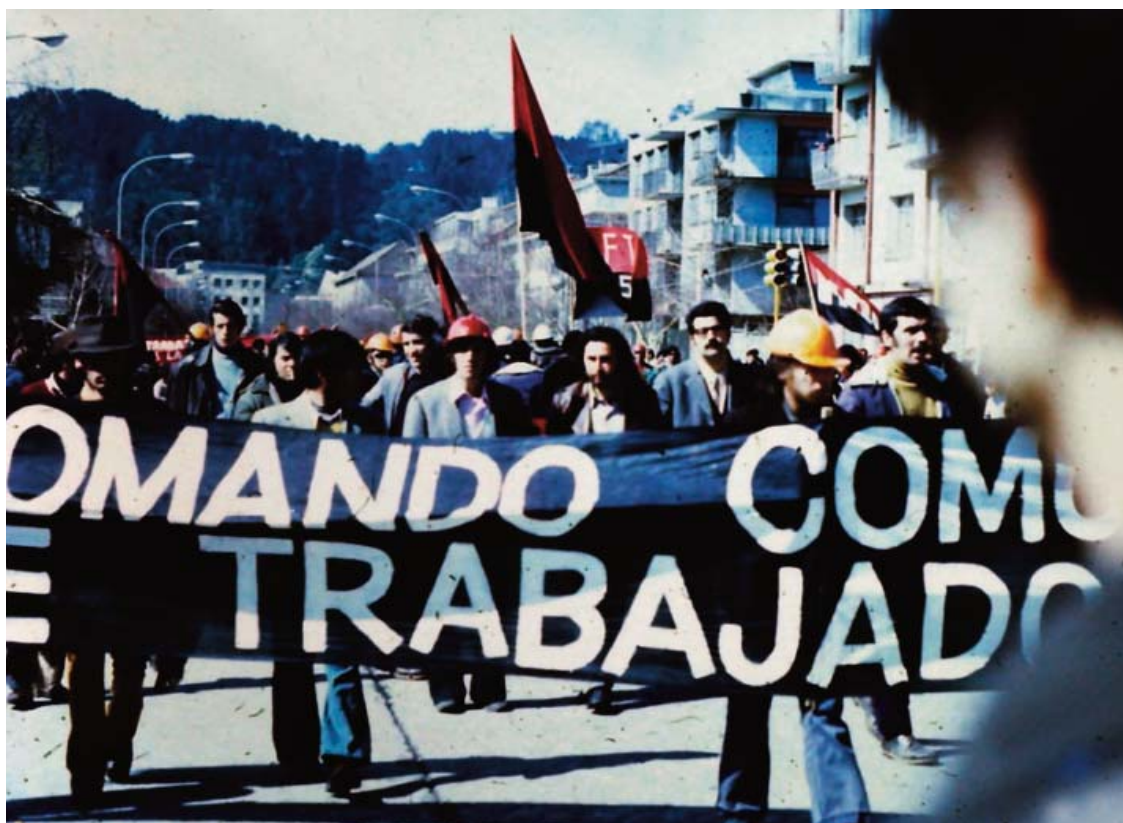
■ 1973, 4 de septiembre, Santiago de Chile. La Unidad Popular y el MIR se manifiestan ante un posible golpe de Estado.