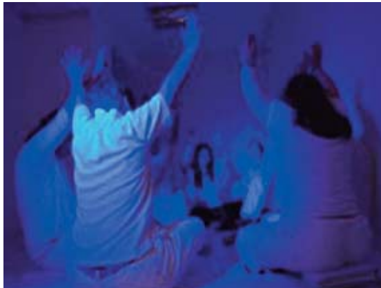
■ «The broken hips»

Desarrollamos paralelamente en el aula del instituto