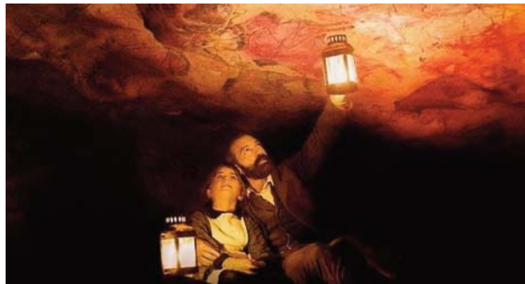
Altamira (2016). Antonio Banderas es Marcelino Sanz de Sautuola