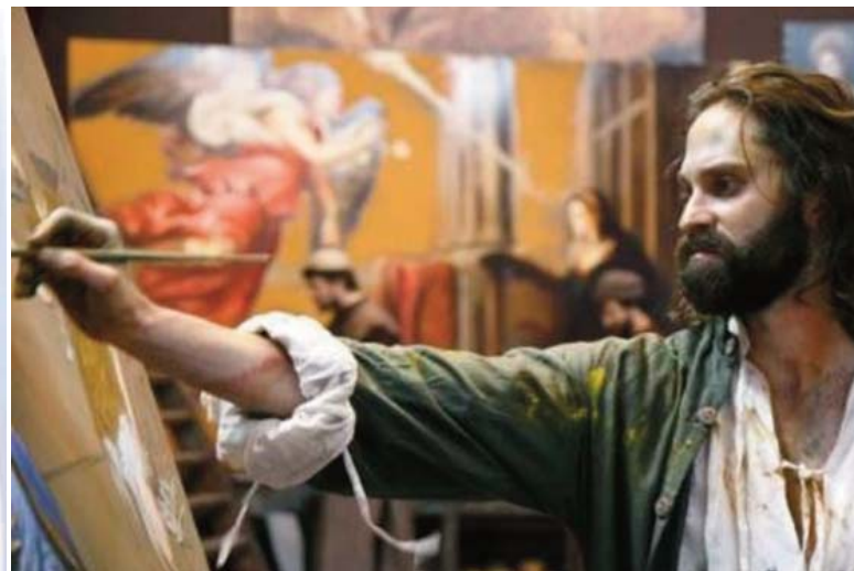
■ El Greco (2007). Nick Ashdon