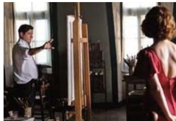
■ El Greco (1966). Mel Ferrer