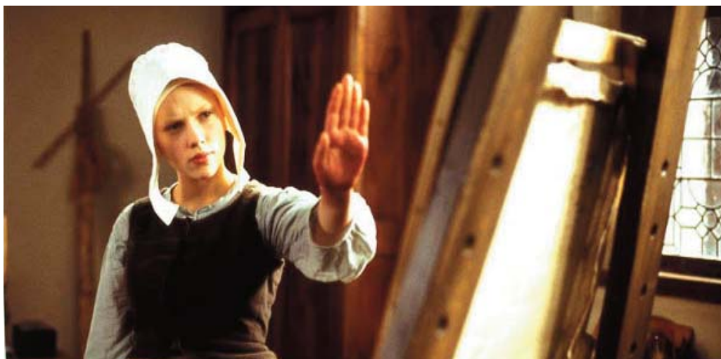
La joven de la perla. Scarlett Johansson