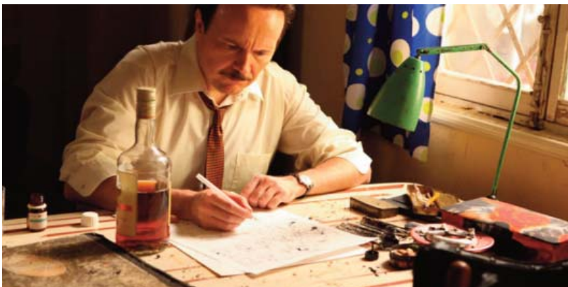
El gran Vázquez (2010). Santiago Segura (Vázquez)