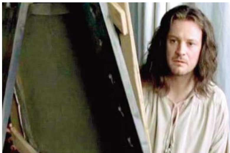
■ La joven de la perla. Colin Firth