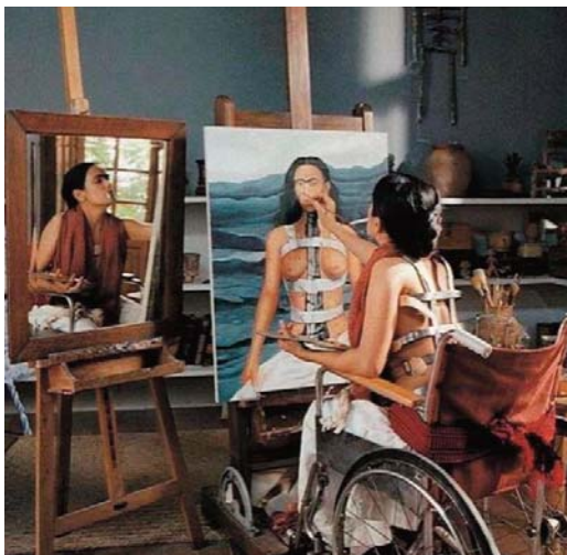
Frida. Salma Hayek