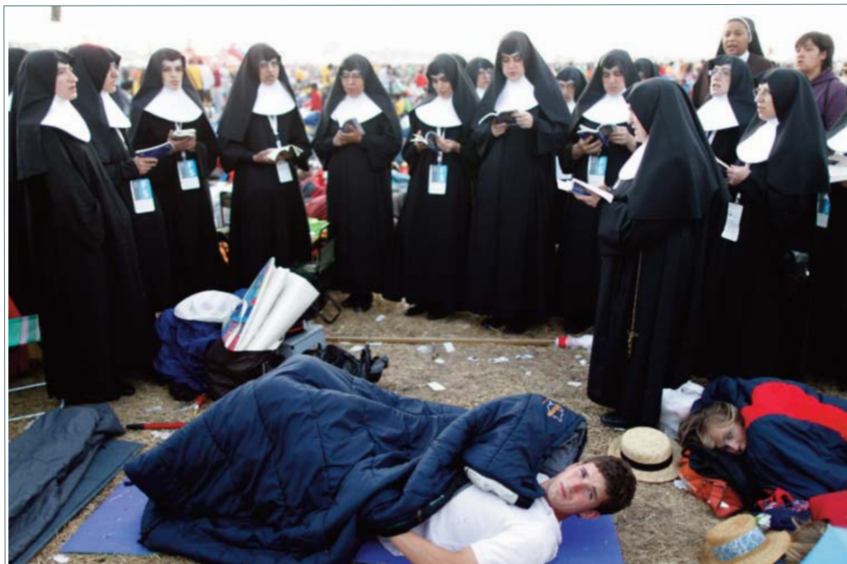
Despertar de unos jóvenes tras la vigilia. Visita del Papa Benedicto XVI a Madrid por la Jornada Mundial de la Juventud 2011, en Cuatro Vientos, el 21 de agosto de 2011.

Más que de una fotografía en concreto, me siento orgulloso de coberturas como la del 15M, la visita del Papa a Madrid durante la Jornada Mundial de la Juventud en