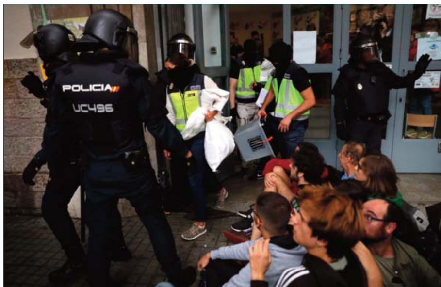
■ Barcelona, 1 de octubre de 2017. Desalojo de la Policía Nacional y retirada de urnas en el Instituto Jaume Balmes, en Barcelona.

Como un género más dentro de la fotografía, la técnica es importante, la composición, el gusto. Hay fotógrafos de prensa que se sienten más cómodos en el re-