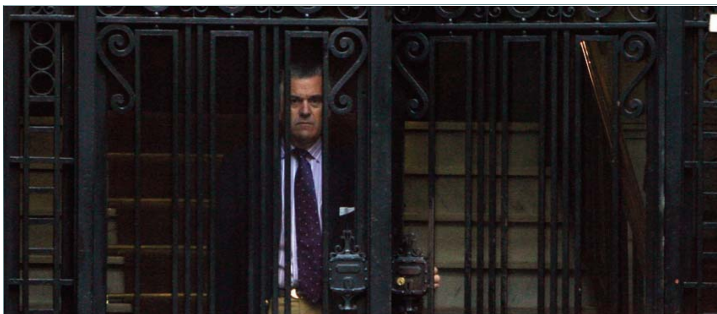
■ Bárcenas sale de su casa. En Madrid, el 21 de julio de 2009.