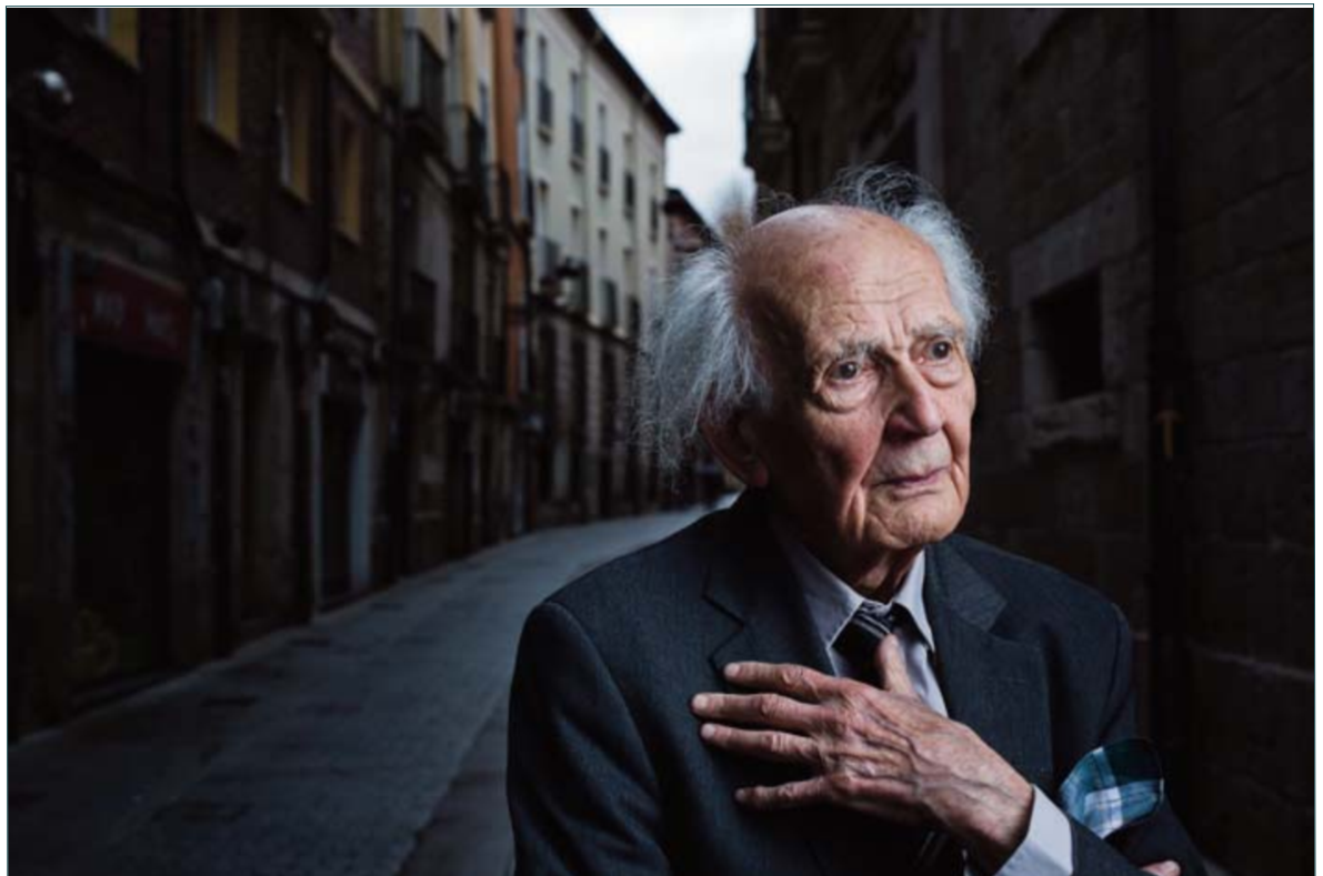
■ Entrevista a Zygmunt Bauman. Filósofo y sociólogo polaco, en Burgos, el 6 de noviembre de 2015.

Es importante que quien se quiera dedicar al mundo del periodismo intente entender todos los lenguajes que se engranan como parte de esta profesión. No creo en el hombre orquesta que hace de todo, porque no va a hacer nada bien, pero sí en que haya más interrelación, y una formación gráfica más completa para redactores que les ayude a “leer” correctamente la imagen y a entenderse mejor con su compañero fotógrafo.