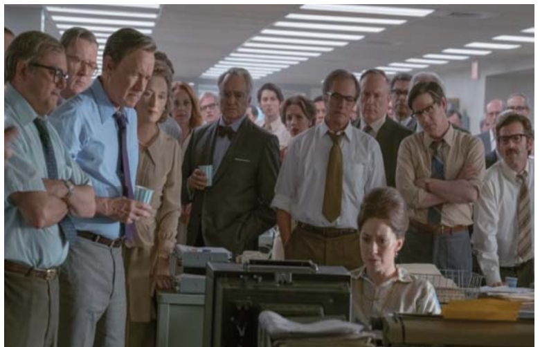
■ The Post. 2017