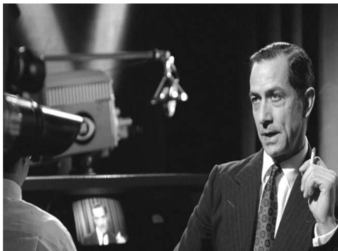
■ Buenas noches y buena suerte. 2005

Por una parte, un ejército de técnicos tratan de salvar a un hombre atrapado en las entrañas de la Tierra. Para ello Tatum pacta con el sheriff (Ray Teal), que