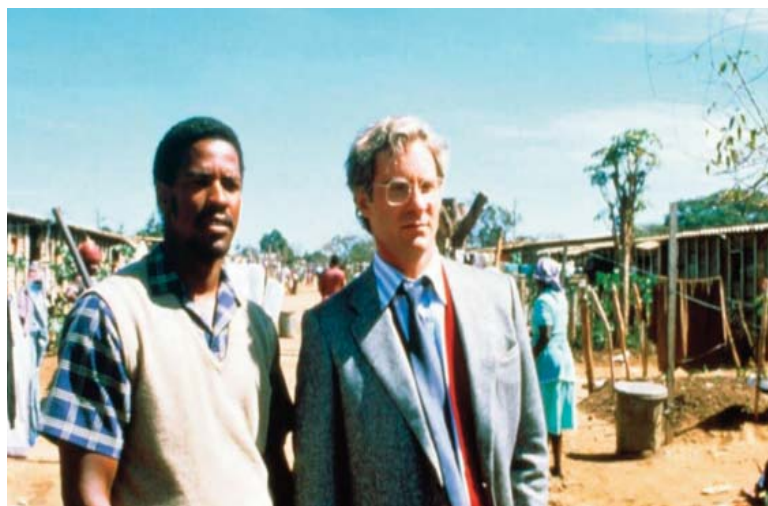
■ Grita libertad. 1987