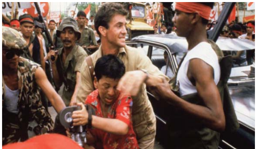
■ El año que vivimos peligrosamente. | 1982