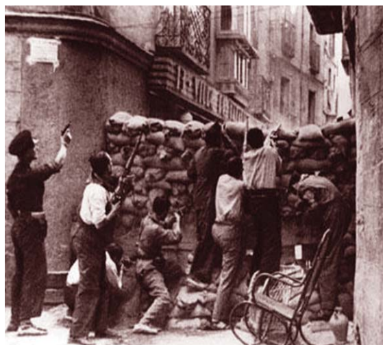
Tierra de España. Joris Ivens (1937)