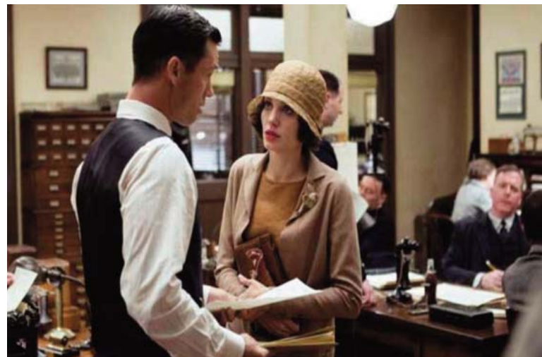
El intercambio. 2017