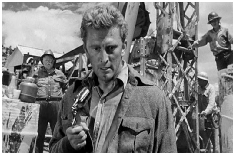
■ El gran carnaval. 1951