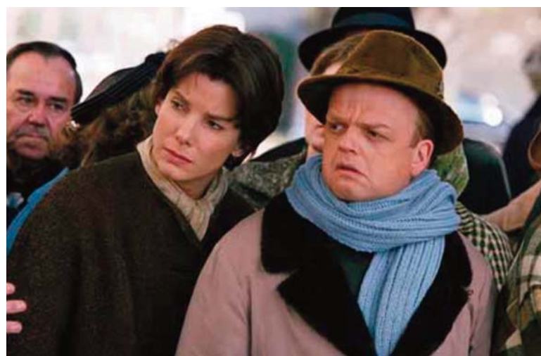
■ The infamous. 2006.