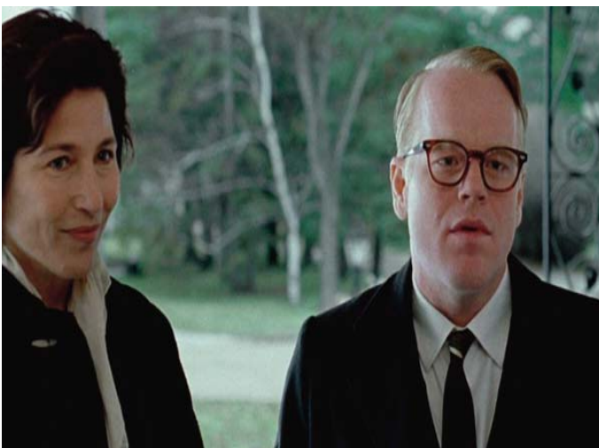
■ Capote. 2005

La trama transcurre entre 1959 y 1965, y narra un fragmento de la vida del escritor cuyo nombre da título a la película, a raíz del asesinato múltiple de una adinerada familia granjera en Kansas, acontecimiento que desembocaría en la publicación en 1966 de A sangre fría .