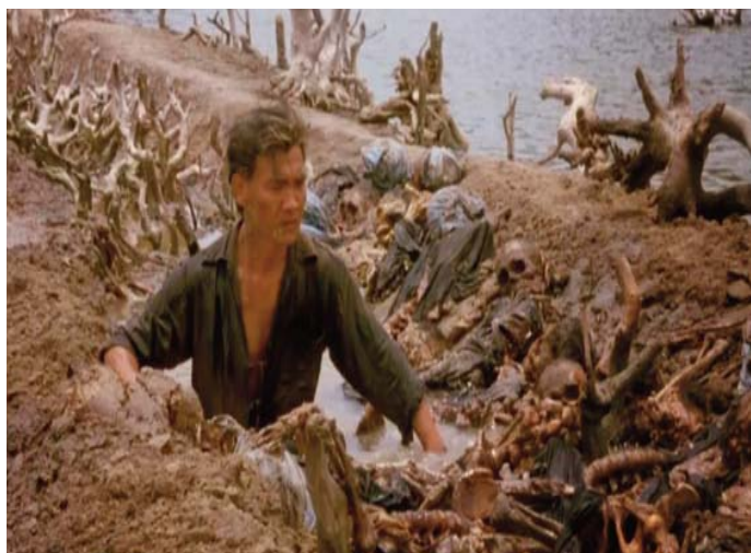
■ Los gritos del silencio. 1984

Attenborough narró la película desde la perspectiva de Donald Woods pues «Si haces una película cen-