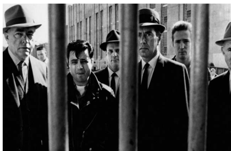
■ A sangre fría. 1967