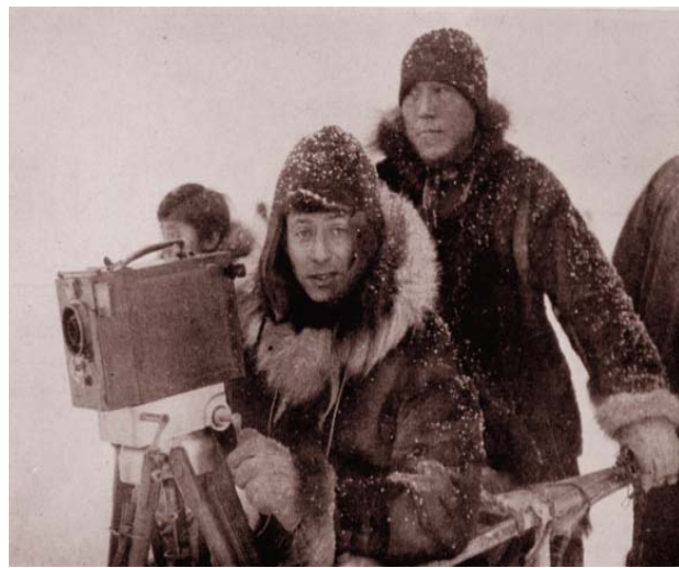
Robert Flaherty. Filma Nanook el esquimal