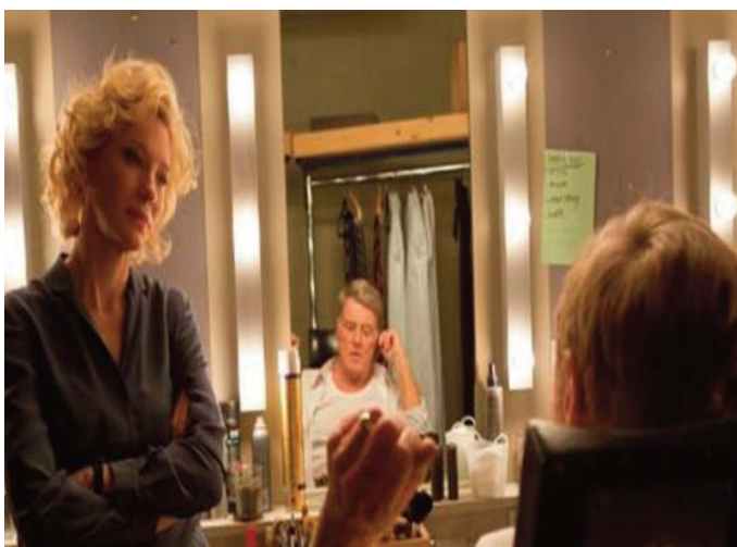
■ La verdad. 2015

Los periodistas, los medios y el público deberán acostumbrarse al periodismo de filtración, pues no es el futuro, sino el presente