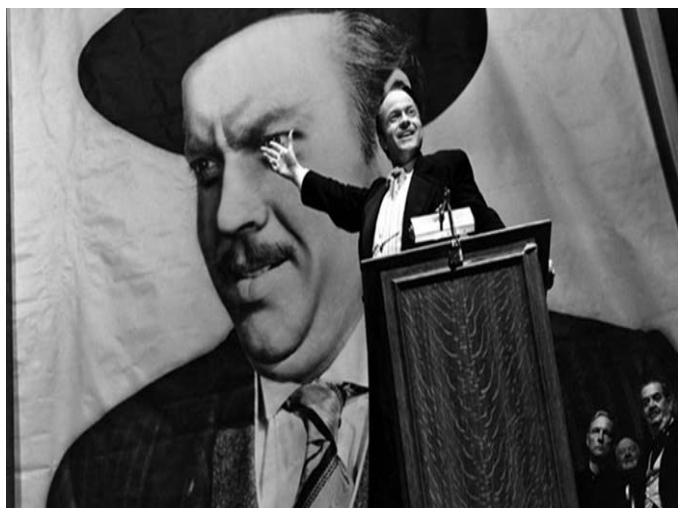
Ciudadano Kane. 1941

El cine ha reflejado en varias ocasiones el papel de los magnates de la prensa. El más significativo, William Randolph Hearst