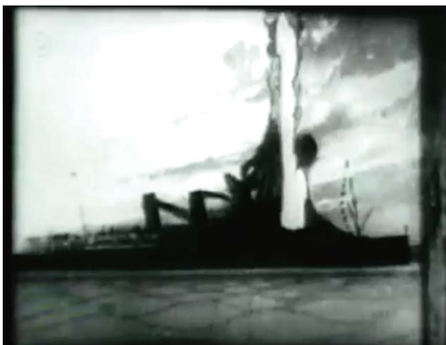
The sinking of Lusitania. 1915

El cine fue el primer medio que usó la imagen en movimiento para hacer periodismo, hasta que fue sustituido por la televisión