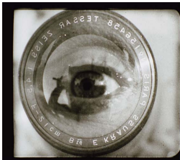
El hombre de la cámara. Dziga Vertov.

El cine, no solamente el documental, es también documento sobre épocas históricas, filosofías y pensamientos, modos de vida y costumbres. A partir del cine debe buscarse la realidad que existe tras la ficción o la ficción que se da tras la realidad. El interés que entraña el cine, su magia y su belleza, la versatilidad de sus técnicas y la infinita gama de contenidos es, en muchas ocasiones, la clave de la investigación sobre otras épocas, historias, relatos o documentos, o sobre el mismo cine, su lenguaje y su tecnología.