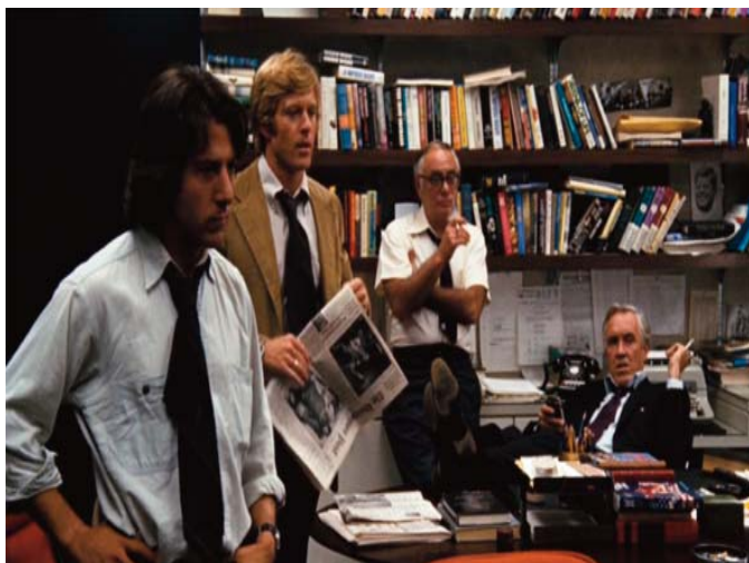
■ Todos los hombres del presidente. 1976

Un grupo mediático, consciente de la importancia de abrir el camino a la verdad, lucha con todas sus fuerzas contra la censura