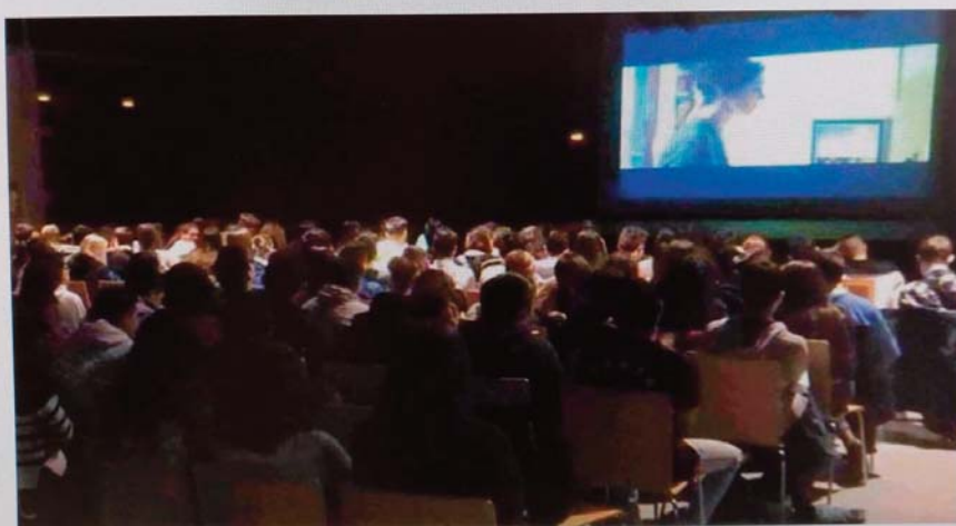
El programa persigue que los escolares lo pasen bien, aprendan cine y crezcan como personas.

HUESCA.- "Las películas me azuzaban la imaginación y la pasión por el cine creció al mismo tiempo que yo. Si algo me ha enseñado una vida dedicada a ver películas es que el cine puede ofrecernos mucho más que un mero entretenimiento. Es un lugar al que podemos ir para descubrir más sobre nosotros mismos, nuestra cultura y el