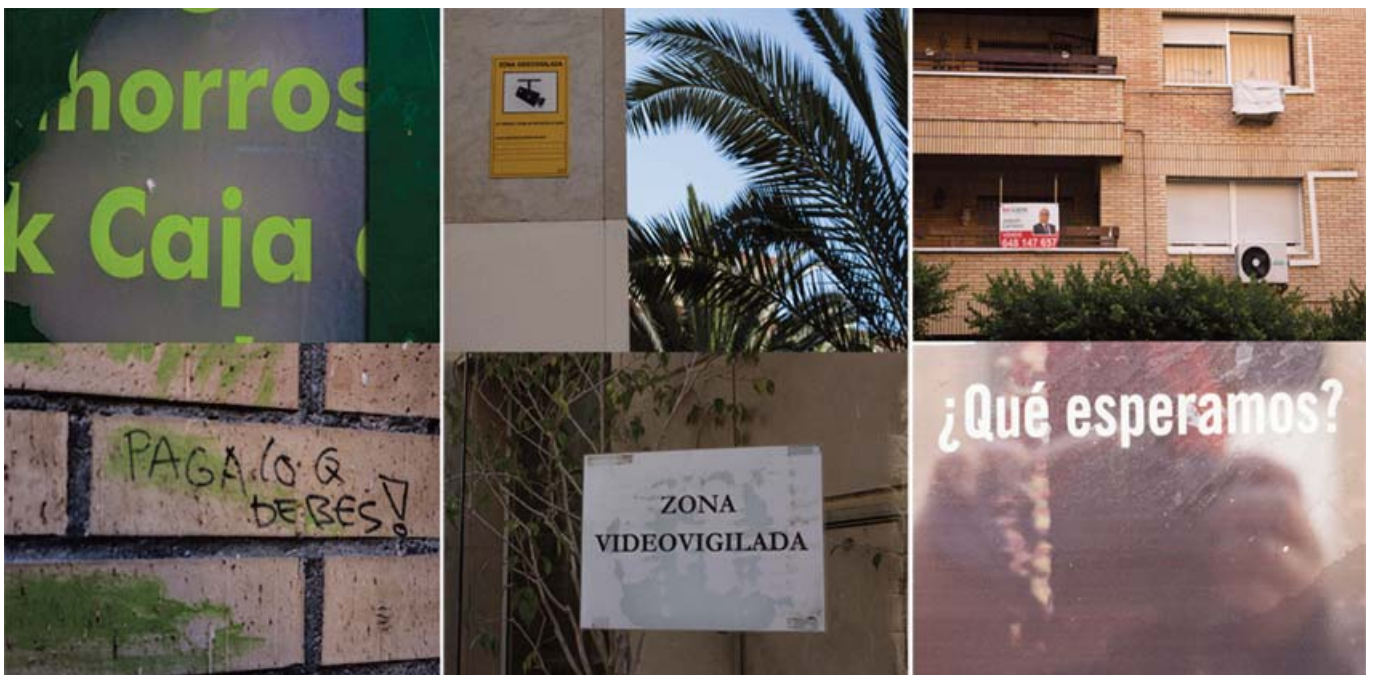
■ Tríptico del proyecto fotográfico “Entren sin llamar” de Elena Pedrosa. Barrio del Casco Histórico. Almería.

Me es curioso comprobar cómo esta tendencia de la fotografía más actual, de fotografiar a los sujetos fuera de su entorno (los habituales retratos «dignifi-