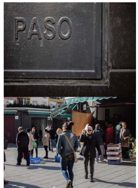
■ Díptico del proyecto fotográfico «Entren sin llamar» de Elena Pedrosa. Plaza Pavía, Almería.