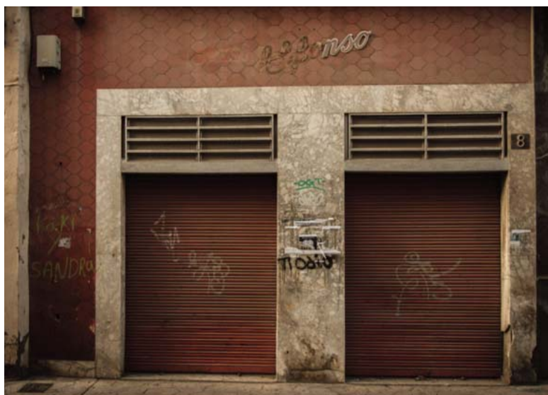
■ Establecimiento cerrado en la Calle Almedina, Almería. Del proyecto fotográfico «Por tiempo limitado» de Elena Pedrosa.

El hecho es que la diversidad «biológica y cultural,