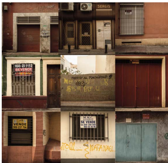
■ Político de establecimientos cerrados, Calle Almedina, Almería. Proyecto fotográfico «Por tiempo limitado» de Elena Pedrosa