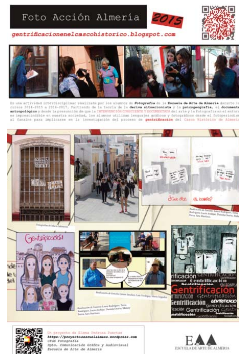
Panel explicativo del trabajo de Foto Acción Almería en 2015. El alumnado realizó actividades de documental fotográfico y videográfico y realización de fanzines artesanales.