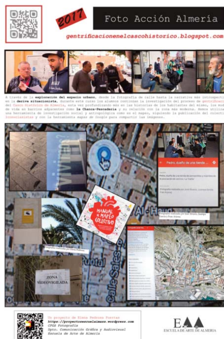
Panel explicativo del trabajo de Foto Acción Almería en 2017. El alumnado realizó actividades de mapeado, psicogeografía y reporterismo en el Casco Histórico y La Chanca.

Y es por eso que he querido detenerme en este punto en los «dilemas y tensiones presentes en las prácticas colaborativas» a los que apunta Palacios en su artículo sobre el arte comunitario, ya que creo que tanto las asociaciones de gestión cultural, como los colectivos artísticos tejedores de cultura, los artistas que tenemos intenciones de agitación política y también los fotógrafos que siguen las modas o las ideas geniales que ven en otras ciudades, tendremos que pensar muy bien si ese material dúctil dado a la creatividad que es la materia de la obra de arte se parece o no se parece a la calle, al barrio, a los vecinos, si tenemos legitimidad para erigirnos como líderes de una élite del conocimiento que quiere crear acciones, situaciones u obra plástica a partir de la materia prima de los problemas de otros, preguntándonos, sobre el concepto de acción artística: «¿En qué posición se sitúa el artista?, ¿es intermediario, traductor, portavoz?, ¿quién decide qué temáticas sociales serán tratadas y representadas?» y en segundo lugar, en cuanto al concepto de comunidad: «¿qué es lo que une re-