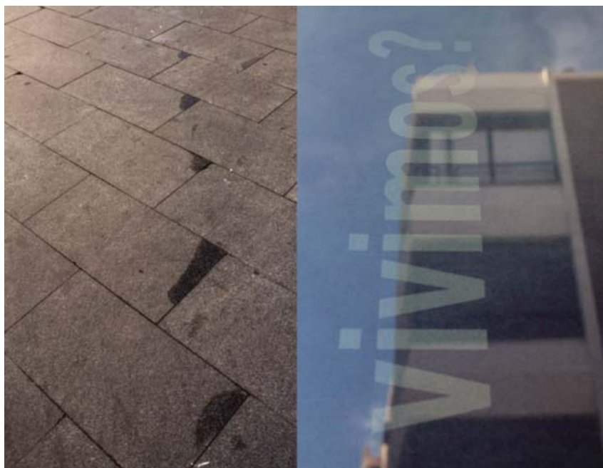
■ Díptico del proyecto fotográfico «Entren sin llamar» de Elena Pedrosa. Calle La Reina, Almería.