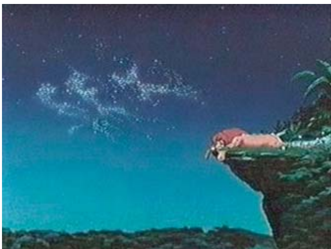
■ Figura 2. El rey León. Sex