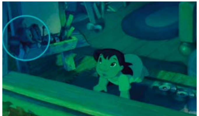
■ Figura 6. Lilo y Stitch

En este apartado se pueden ver dos ejemplos. El primero de ellos corresponde a la película «Lilo y Stitch», en la que la protagonista, la niña que da nombre a la película —Lilo—, tiene entre sus juguetes un peluche del elefante «Dumbo», en una clara referencia a la película del mismo nombre estrenada en 1941. Figura 6