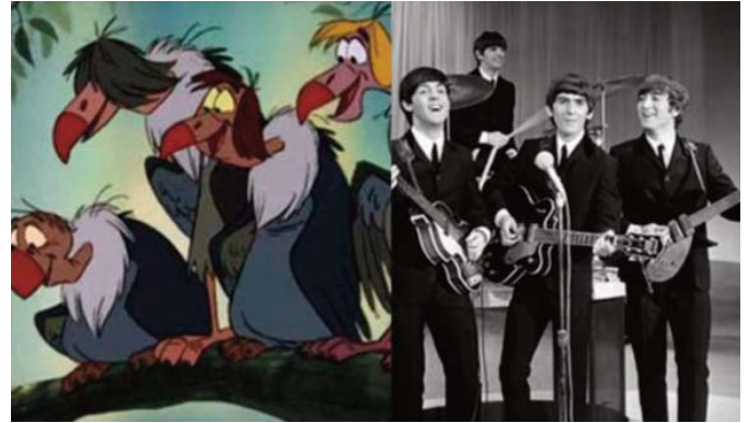
■ Figura 5. El libro de la selva. The Beatles

Si de guiños hablamos, uno de los más singulares se da en la versión de dibujos animados de «El libro de la selva» —estrenada en 1967—, en la que en un momento de la película aparecen cuatro buitres bastante inusuales posados sobre la rama de un árbol. Estos, con flequillos y peinados se asemejan a John Lennon, Paul McCartney, George Harrison y Ringo Starr, los componentes de la mítica banda inglesa The Beatles , que en el momento del estreno de esta película vivía uno de sus momentos de mayor auge. Figura 5,