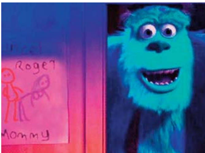
■ Figura 3. Monstruos S.A.

deza visual, ya que, a simple vista, puede pasar completamente desapercibido el cielo de estrellas que centra el plano de la secuencia mostrada sobre estas líneas. Tal y como aparecen ubicadas las estrellas, estas forman la palabra «SEX» (sexo). Aunque los productores de la película aseguraron que en lugar de «SEX», querían reflejar las siglas «SFX», como guiño al departamento responsable de los efectos especiales, en cualquier caso, es innegable que existía una clara intención de transmitir un mensaje oculto mediante la distribución o colocación de las estrellas que aparecen en la imagen. Figura 2