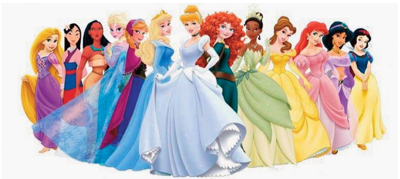
■ Figura 4. Princesas Disney

Por su parte, la segunda imagen es de la producción animada titulada «Monstruos S.A.». En la secuencia referida, se observa junto a la puerta una muñeca en el suelo. Esta no es otra que una réplica de la vaquera Jessie, de «Toy Story», ambas películas realizadas por la compañía Disney. Figura 7