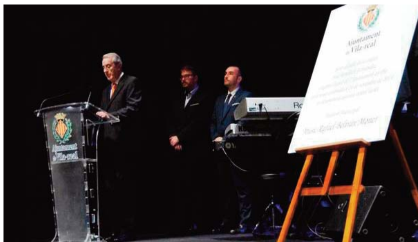
En el Auditorio Municipal de Vila-real «Rafael Beltrán Moner»