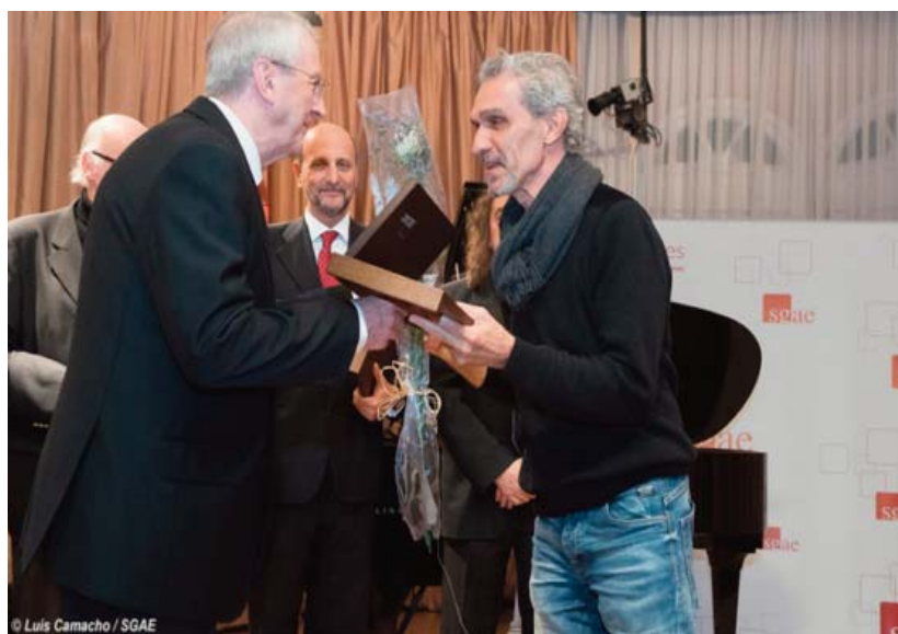
Junto a otros autores recibió un homenaje de la SGAE el 23 de noviembre de 2016, en la sede madrileña de la Sociedad de Autores.

“convertir la clase en una discusión sobre el por qué ese tipo de música era más o menos conveniente”