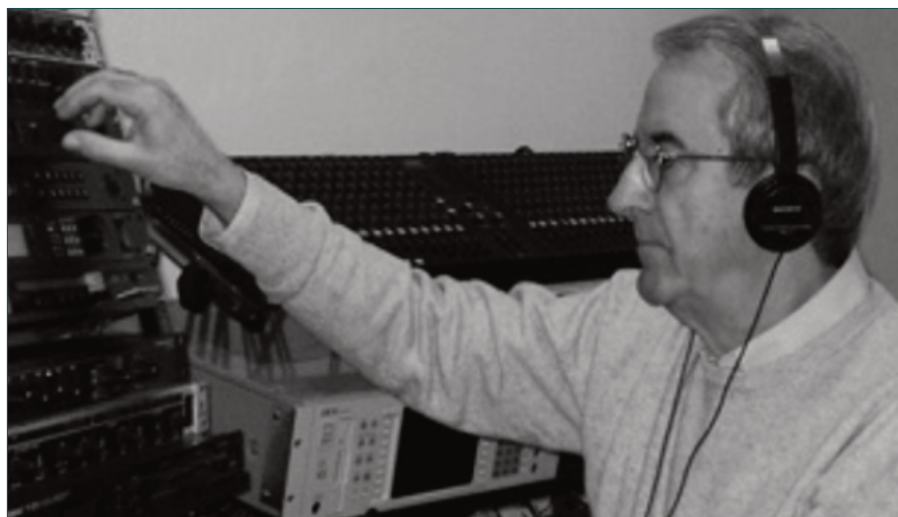
En el estudio de sonidos

Todo surge cuando RTVE cree en la posibilidad de realizar un curso sobre ambientación musical. Aunque en aquel momento la ordenanza profesional de la época aún no reconociera este título como tal y al igual como ocurriese en Radio Nacional, se continuaba de-