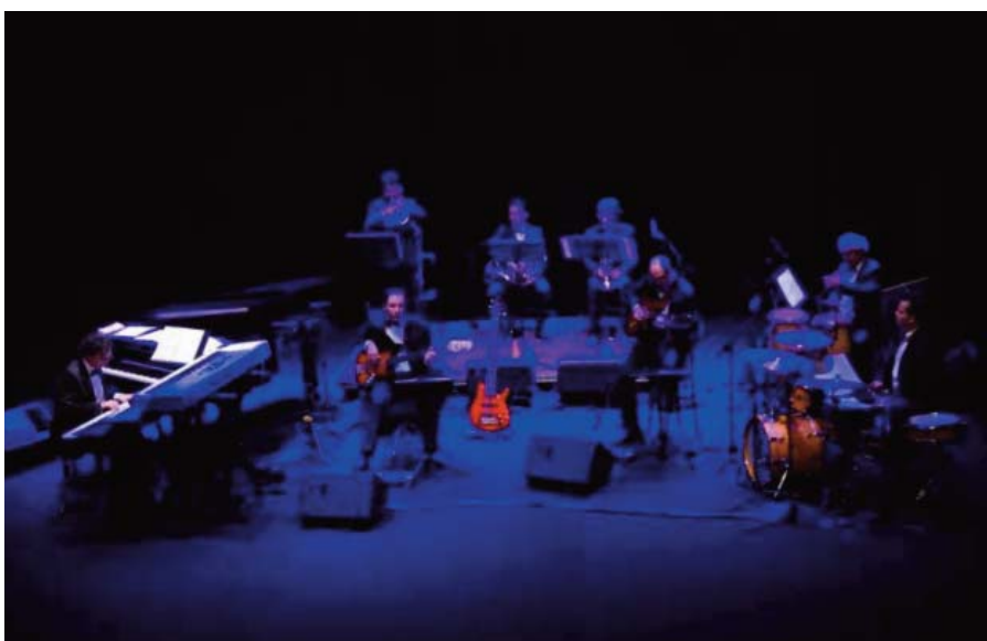
Concierto en el Auditorio Rafael Beltrán, en Castellón

Finalmente el curso quedó suspendido para los profesionales internos de televisión, contratando profesores externos para que no hubiese mal entendidos entre los profesionales del propio cuerpo de televisión.