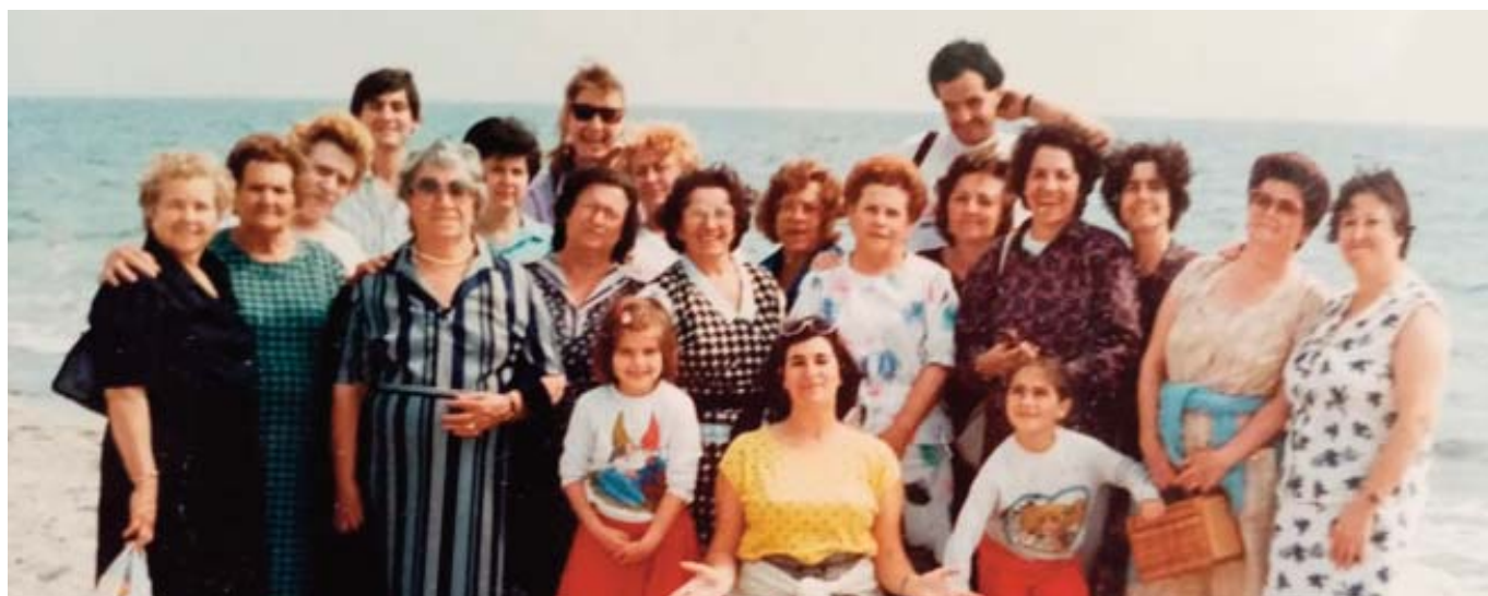
El grupo de las primeras alumnas del Centro de Adultos de 500 Viviendas, de Almería, en un viaje a la playa

“Tuvimos muy claro desde el comienzo la necesidad de integrarnos en el medio y ayudar a nuestros alumnos a hacerlo”