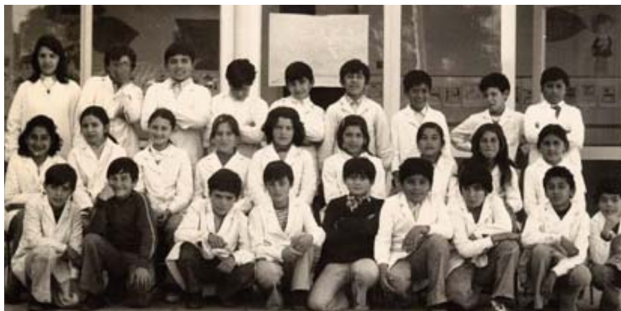
En 1976, en la Escuela de San Miguel, en Argentina

“ A los niños, era necesario interesarles y despertarles la curiosidad, creando un ambiente de alegría y cercanía