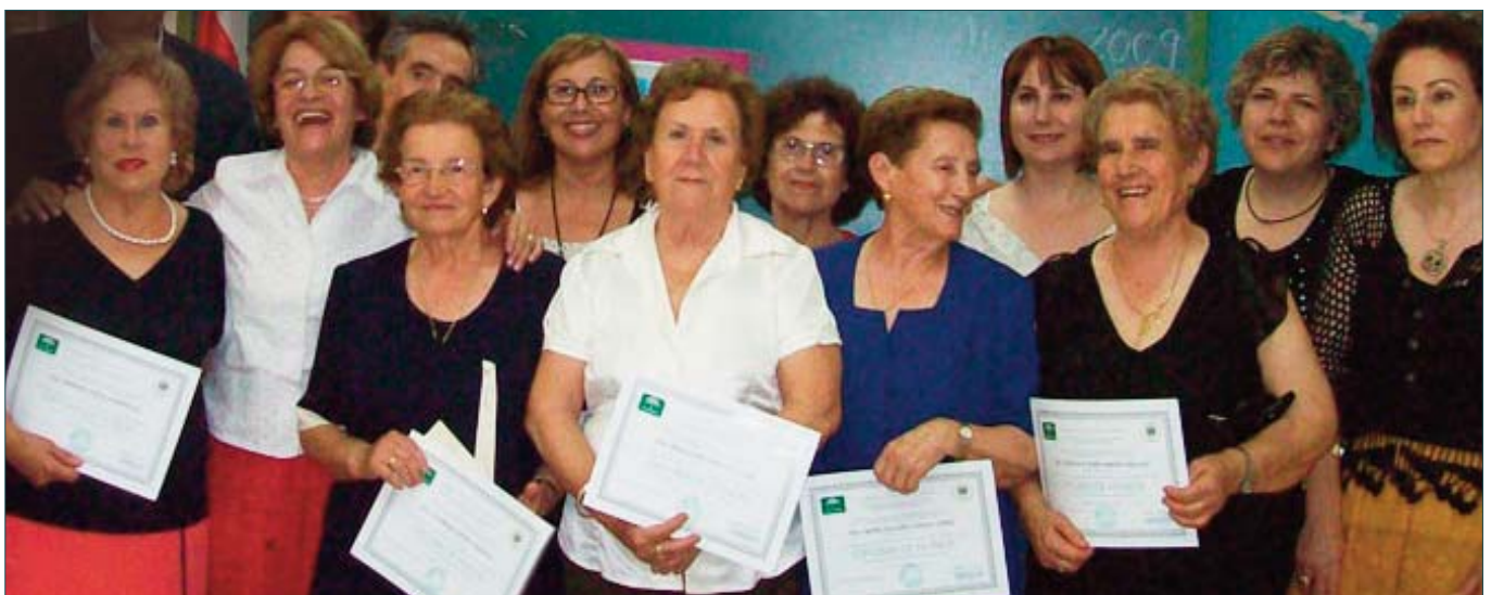
Algunas de las primeras alumnas del Centro de 500Viviendas de Almería, 25 años después

Otras mujeres, se animaron a ser emprendedoras en otros campos, montar o dirigir pequeños negocios y sacar adelante a sus familias.