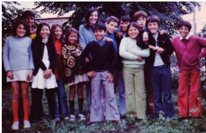
En 1977, en la Escuela Trujui, en el Cruce Castelar, Argentina